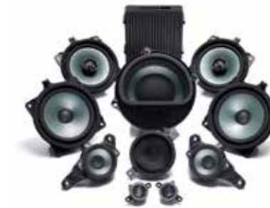
Premium Soundsystem: 9 Lautsprecher, Subwoofer und Verstärker

Navigations- und Audiosystem Mit seinem 7"-Bildschirm fährt das Navigationssystem Sie sicher an jeden Ort. Das Audiosystem wiederum wird Sie perfekt unterhalten und ist ausgesprochen klangstark. High-End-Ambitionen erfüllen zudem das Navigations- und Soundpaket mit Subwoofer und 9 Lautsprechern inklusive 2 Hochtönern.