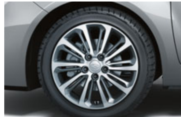
Zubehör: 17" Aluminiumfelgen