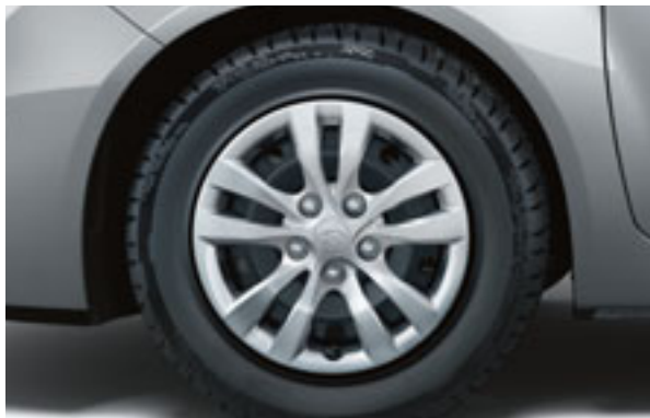
Origo: 15" Stahlfelgen mit Radzierblenden