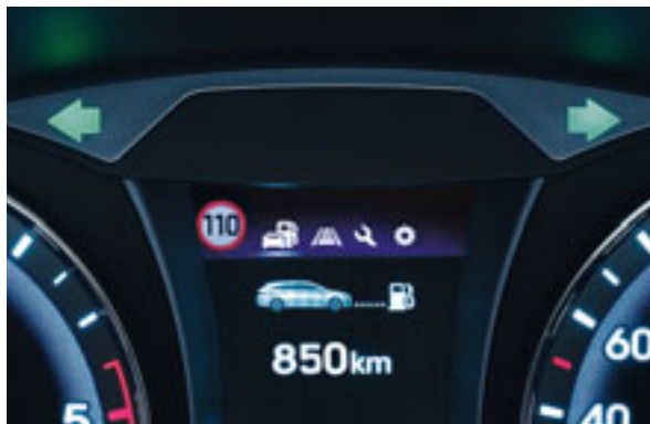
Verkehrszeichenerkennung. Die neue Tempolimit-Funktion überwacht die Verkehrszeichen am Strassenrand und zeigt die aktuelle Geschwindigkeitsbeschränkung auf dem neuen, hochauflösenden TFT-Display an.