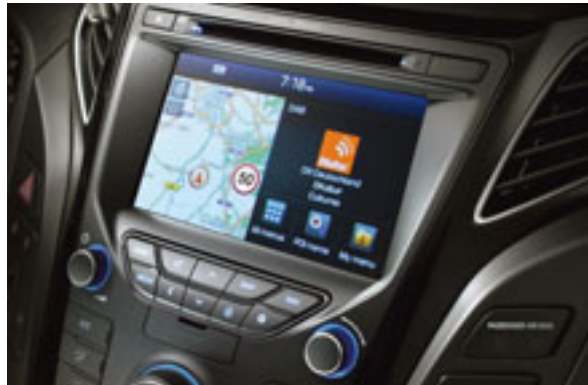
Neues Navigationssystem mit DAB+. Unser Satellitennavigationssystem der neuesten Generation ist mit einem 7" grossen TFT-Farbdisplay ausgestattet, das bessere Touchscreen-Funktionen, einen neuen 3D-Anzeigemodus und DAB+ Digitalradio für klaren Klang bietet.

Mit jedem Blick und jeder Berührung werden Sie sofort die hochwertige Qualität spüren, die ein integraler Bestandteil des New Hyundai i40 ist. Hochwertig ist auch die moderne Technologie, mit der der i40 angeboten wird. Damit wird Reisen so sicher und stressfrei wie möglich. Das sind nur wenige Beispiele für die benutzerfreundlichen Technologien, mit denen die Fahrt im i40 zur reinen Freude wird.