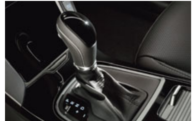
Doppelkupplungsschaltgetriebe. Das 7-Gang-Doppelkupplungsschaltgetriebe DCT bringt deutliche Vorteile bei Leistung und Verbrauch. Erhältlich mit dem leistungsstarken 141-PS-Dieselmotor.