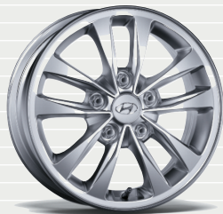
Origo® 195/65 R15