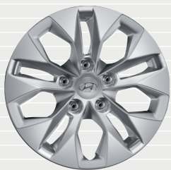
Pica® 195/65 R15