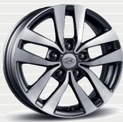
Amplia® 205/55 R16