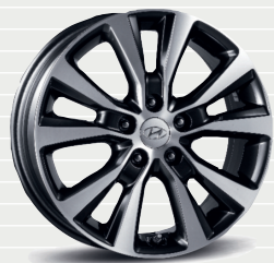
Vertex® 225/45 R17