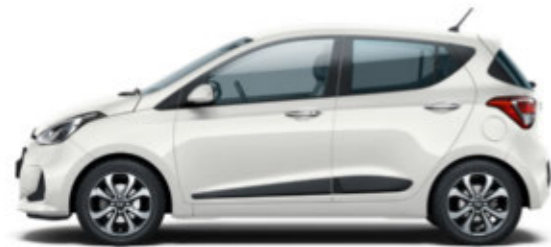
Polar White (PSW)