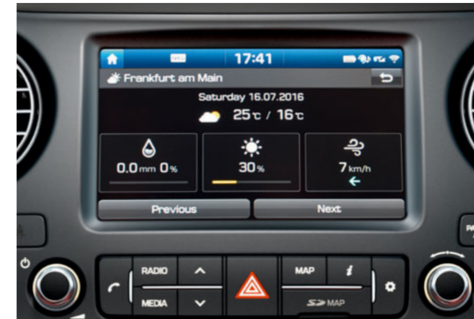
Navigation mit TomTom LIVE Services. Das Navigationssystem informiert mittels TomTom LIVE Services (7 Jahre gratis) über die aktuellste Verkehrslage, interessante sowie nützliche Ziele, und Wetterbedingungen.

Fortschrittliche Konnektivitätslösungen sind eine der Stärken des neuen Hyundai i10. Das neue Navigationssystem mit TomTom LIVE Services, Apple CarPlay™* und Android Auto™** lässt sich einfach mit iPhones und kompatiblen Android-Smartphones verbinden. Damit bleiben Sie immer informiert, in Kontakt mit Ihren Liebsten und bestens unterhalten.