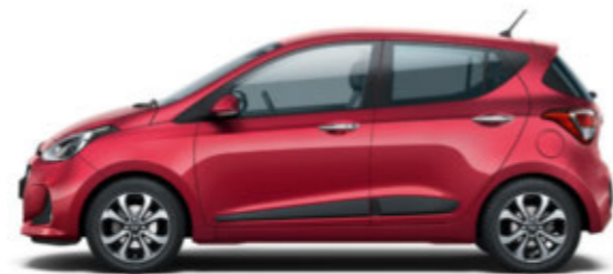
Passion Red (X2R)