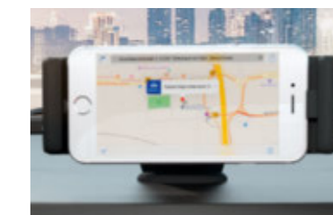
Smartphone Docking Station. Die Smartphone Docking Station (als Zubehör erhältlich) positioniert das Smartphone optimal und erleichtert so die Steuerung und Wiedergabe von Musik, das Telefonieren sowie die Navigationsfunktion, während die Batterie des Smartphones geladen wird.