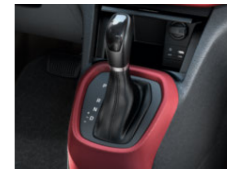
4-Gang-Automatikgetriebe. Das Automatikgetriebe sorgt selbst im hektischen Stadtverkehr für eine stressfreie Fahrt.