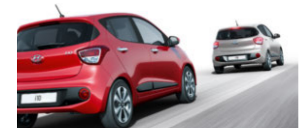
Frontkollisionswarnsystem. Mittels Frontkamera warnt das System vor einer potentiellen Kollision mit einem vorausfahrenden Fahrzeug.