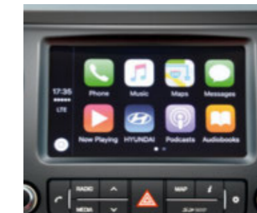
Apple CarPlay™* und Android Auto™**. Das 7 Zoll Navigationssystem ist mit Apple CarPlay™* und Android Auto™** kompatibel. Bestimmte Apps und Funktionen Ihres Smartphones lassen sich so ganz einfach und sicher auf dem Touchscreen darstellen und bedienen.