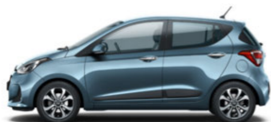
Aqua Sparkling (W3U)