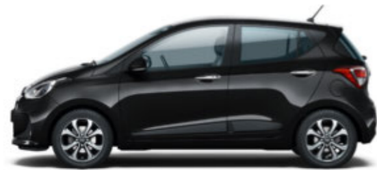
Phantom Black (X5B)