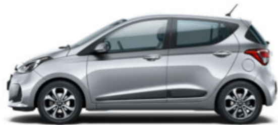
Sleek Silver (RYS)