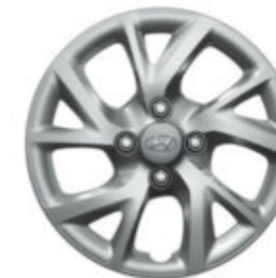
14" Stahlfelgen mit Radzierblenden