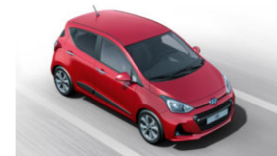
Spurhalteassistent. Visuelle und akustische Warnung bei unbeabsichtigtem Verlassen der Fahrspur, sobald dies die Frontkamera feststellt.