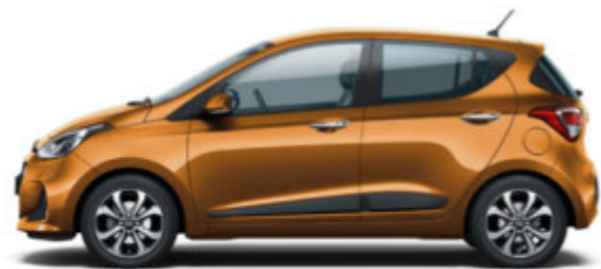
Mandarin Orange (T5A)