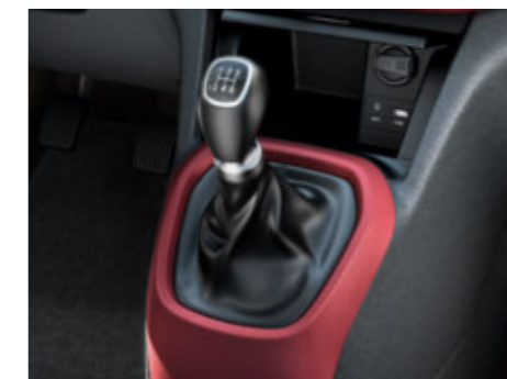
5-Gang-Schaltgetriebe. Das präzise manuelle Schaltgetriebe sorgt für extra Fahrspass.

Neu entwickelte Motoren und Getriebe liefern Leistung in Kombination mit geringem Verbrauch und geringen Emissionen. Sie haben die Wahl zwischen einem 1.0-Liter-Dreizylinder mit 66 PS (48.5 kW) oder einem 1.2-Liter-Vierzylinder mit 87 PS (63.8 kW). Zudem besteht die Wahl zwischen einem präzisen 5-Gang-Schaltgetriebe oder einem 4-Gang-Automatikgetriebe. Für welche Variante Sie sich auch entscheiden, der Schalthebel ist so hoch angebracht, dass Sie ihn bequem erreichen und bedienen können.