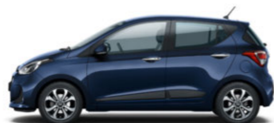
Morning Blue (X3U)