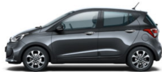
Star Dust (V3G)